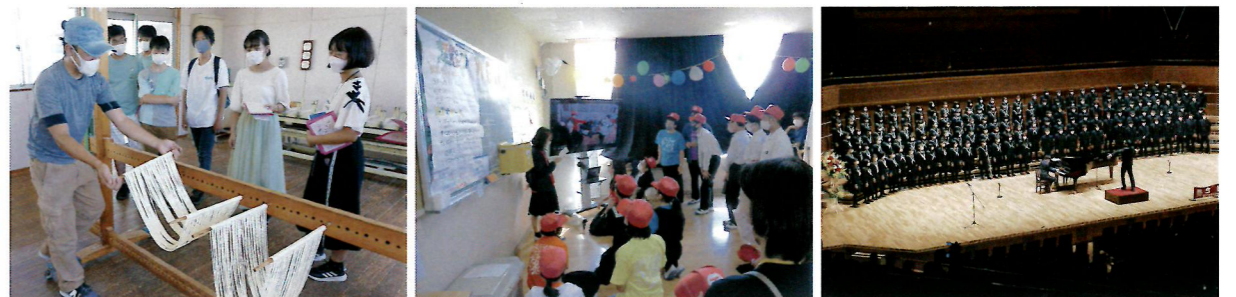
小豆島の生活（2年生宿泊行事）